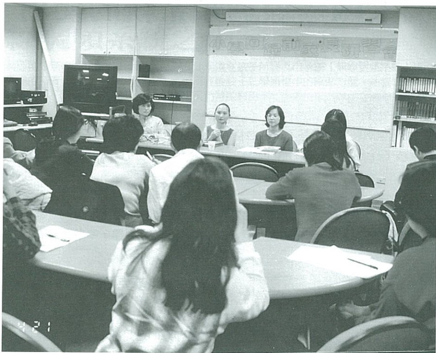
▲家長們齊聚一堂，經驗交流與分享。

舉個例子：大家一起玩跳棋、丟球、比賽的遊戲，當他輸時，我趁他還沒出現消極情緒前先稱讚他：雖然輸了，可是不会因此發脾氣、亂鬧。同時帶頭請大家為他拍拍手，一邊誇他真是有風度。頭幾次他在尊嚴被提升的驅使下，紅眼眶，抿嘴角慢慢轉變成柔和的微笑，後來他甚至在輸時，自動稱讚贏家：「佩服！佩服！真是厲害。」（以前看過我對贏家的反應。）換我輸時（有時是故意的），我保持開朗的笑容，輕鬆的說：「雖然我輸了，可是我很認真的玩，而且玩得很過癮、很有意思，再繼續加油就好了，才不灰心呢！」當我贏時，我開心的說：「雖然我贏了，可是我不驕傲，不譏笑人。我們是好朋友，一起玩得很高興才好玩。如果只愛比來比去、怕輸，那就沒意思了，愛心也會越來越少。」很愉快的先說出正面的話，後來這些就變成是他的感覺。輸了之後，有時他也會自動說出類似的話。對輸贏有正確的看法，做事有正確的推動力，不讓惡性競爭破壞我們的生活品質。等他上學和同學相處時，也不會得失心太重，易忌妒別人，人際關係也會比較好。想想，這樣的觀念適合給所有的孩子（大人），不論是否有身體障礙。此篇經驗談，題目沒有『回歸』這二字。分享給所有家中有預備回歸