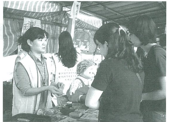
▲博覽會中為民衆解說聽力資訊。

由台大社會系主辦之『第一屆社福機構博覽會』於90年5月5日熱鬧的展開，針對大專院校相關科系做社福機構宣導與交流，共計有32個單位參與。基金會參與了本次活動宣傳與義賣的項目，重點在於讓大眾多認識基金會與宣導聽障相關知識，同時聽力室也準備了聽輔器材試戴品，讓大家可以實際體驗它的功用；並有耳朵模型以供解說。另外透過社工的介紹，讓學生們能有機會接觸、了解聽障的領域，希望未來能有更多人關心、投入。活動在下午四點左右結束，工作人員雖然疲累，心裡卻是感動的，畢竟宣揚基金會的服務，期待更多聽障孩子能因此而走出寂靜的世界，是大家一致的目標。