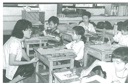
『快樂新鮮人夏令營』上課狀況。

今年七月，南部中心更為今年回歸小學的孩子和家長策劃一個『快樂新鮮人夏令營』，這是由國小老師所主導，為期三天的活動，同時也是基金會所有老師給今年上小學的孩子們的大禮物。讓所有的孩子在國小老師的帶領下，一起預習小學的生活，並希望在今年九月時，基金會的孩子都能以自信、興奮的心情邁入國民小學的學習殿堂。更棒的是，我們也和高雄市教育局合作，在八月份邀請今年所有回歸學生的國小老師到基金會研習，讓老師們了解在課堂上如何幫助聽障小朋友以及配戴無線調頻系統〔FM〕的重要性。