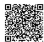
捐款資訊 不公開表單

我不同意公開捐款資訊（若勾選此項目，請掃描右側 QR code 填寫「捐款資訊不公開」表單）