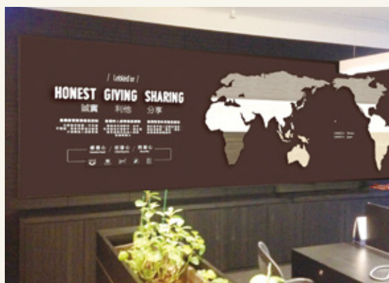
圖 | 三麥之心「感恩心、初發心、同理心」