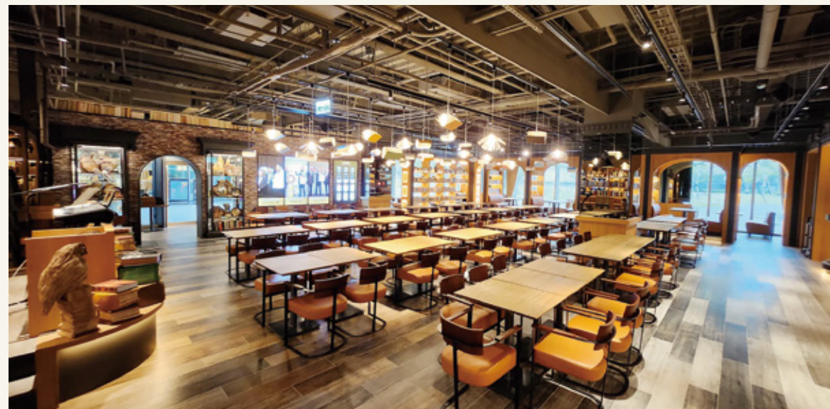
圖 | 金色三麥廣大的現場，需要每一位夥伴的支撐

對這些夥伴們而言，那一個笑容、那一個手勢，不只是體諒，而是被信任的回應。這些瞬間，更讓同事們相信：這些夥伴，早已是能並肩撐起現場的家人。