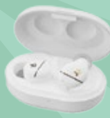
FORGE NC 智慧運動降噪耳機