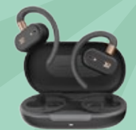
TREK 自適應開放式耳機