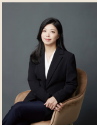
圖 | 陳副總經理