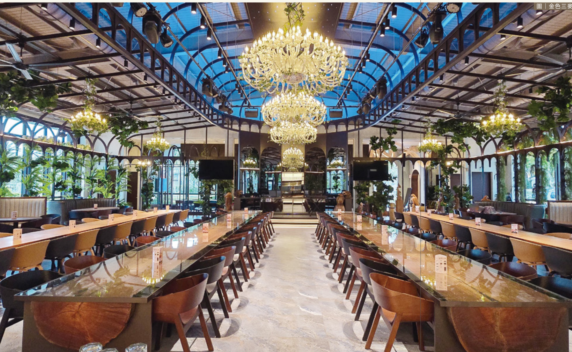
圖 | 金色三麥