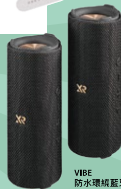
VIBE 防水環繞藍牙音響