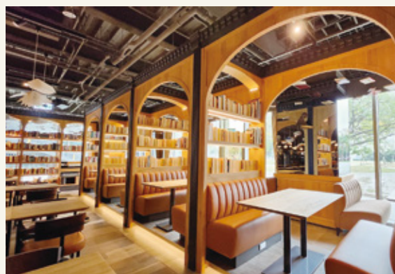
圖 | 金色三麥桃園藝文店