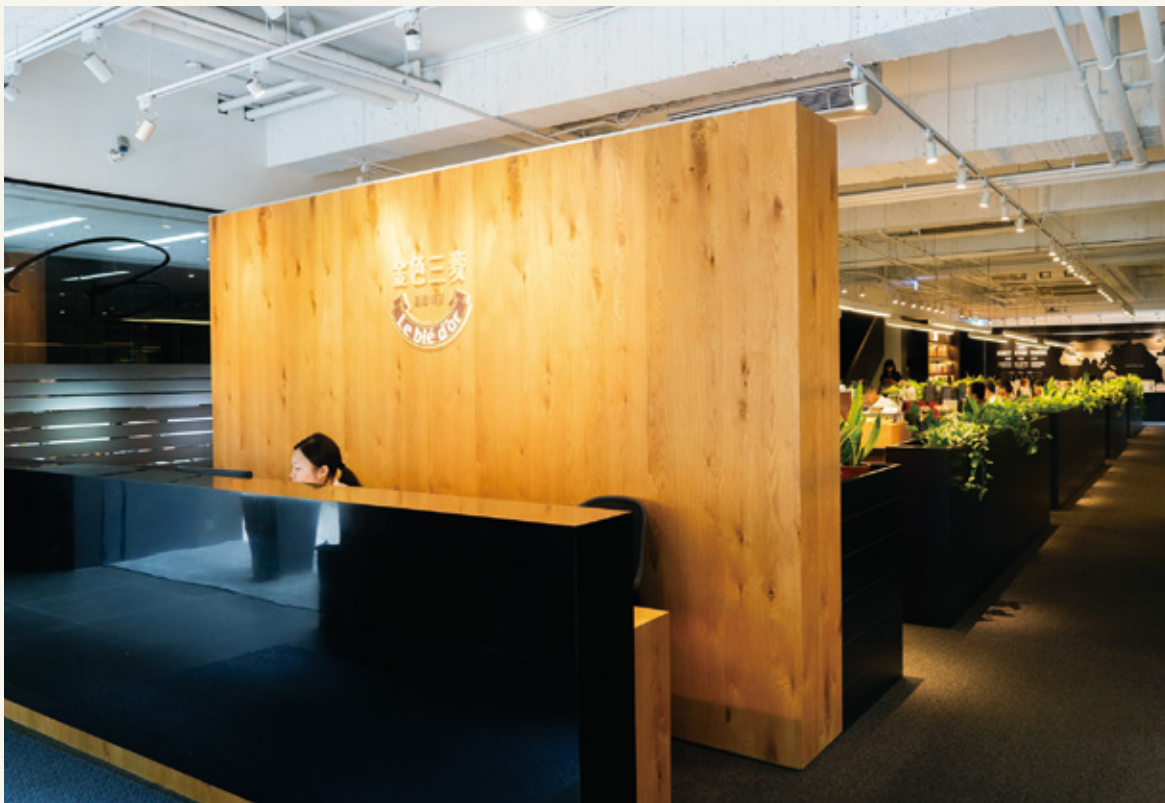
圖 | 金色三麥總部，會議在此開始